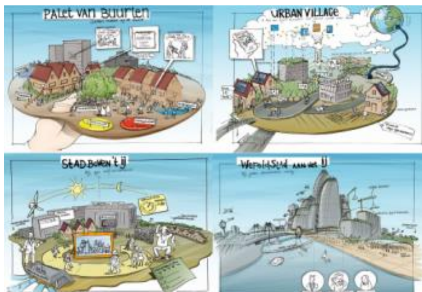
Afbeelding 1: Toekomstbeelden - De Ruyter Strategie 3